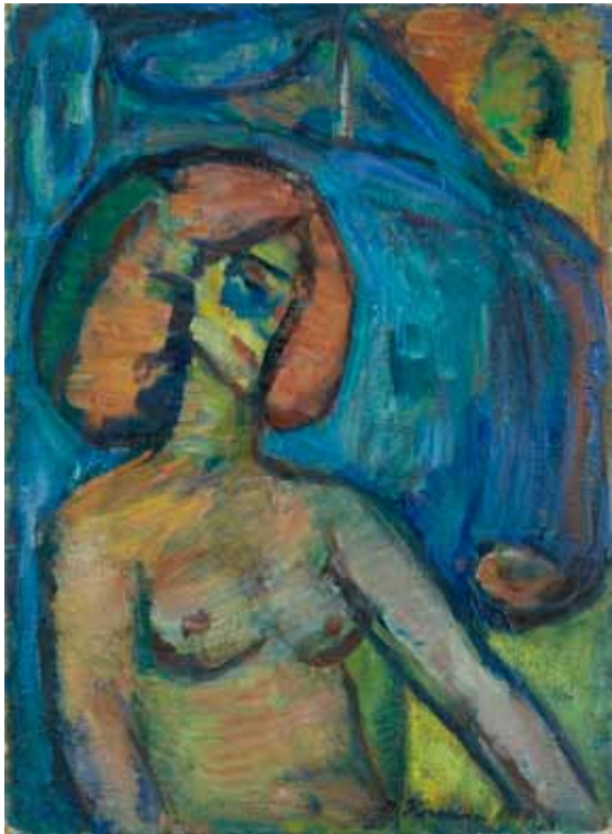
Crvenokosa djevojka – Justina, 1966–1967. ulje/platno 880 x 645 mm inv. br. GKD-8 Galerija Klovičevi dvori, Zagreb