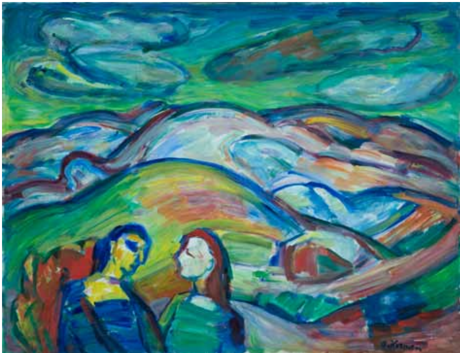
Susret u prirodi , 1970. ulje/platno 890 x 1160 mm inv. br. GKD-4 Galerija Klovičevi dvori, Zagreb