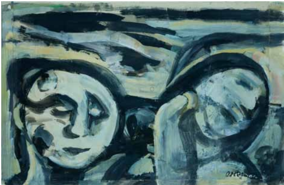
Udovice , 1968. tempera/papir 320 x 493 mm inv. br. GKD-43 Galerija Klovičevi dvori, Zagreb