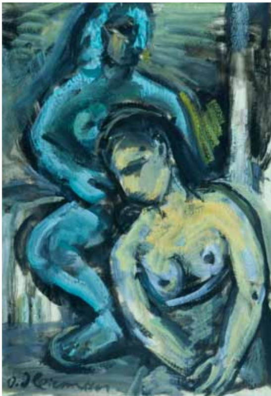
Plavi i žuti akt , 1967. gvaš/tanki papir 405 x 305 mm inv. br. GKD-188 Galerija Klovičevi dvori, Zagreb