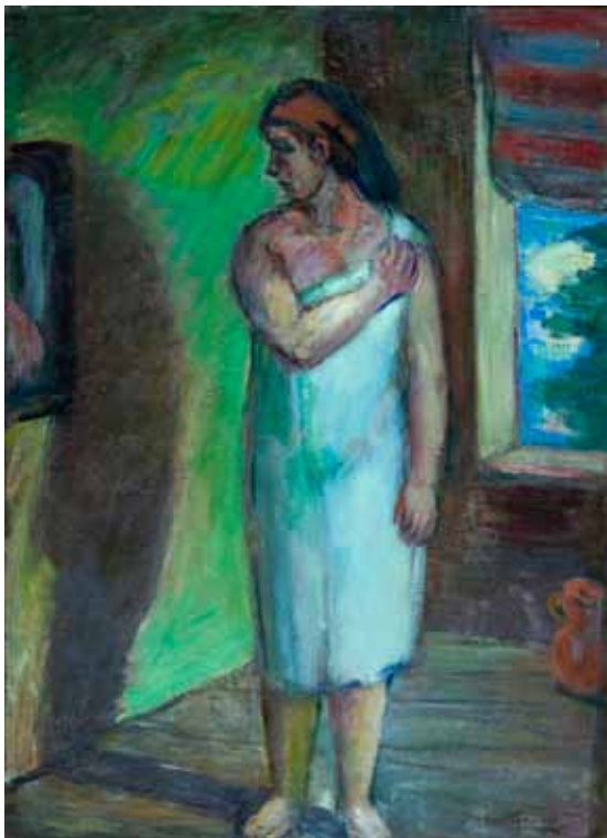
Žena pred ogledalom , 1946. ulje/platno 1110 x 810 mm inv. br. GKD-2 Galerija Klovičevi dvori, Zagreb