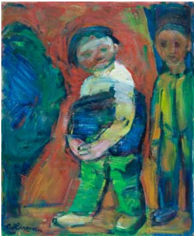
Dječaci , 1972-1973. ulje/karton 595 x 495 mm inv. br. GKD-33 Galerija Klovičevi dvori, Zagreb