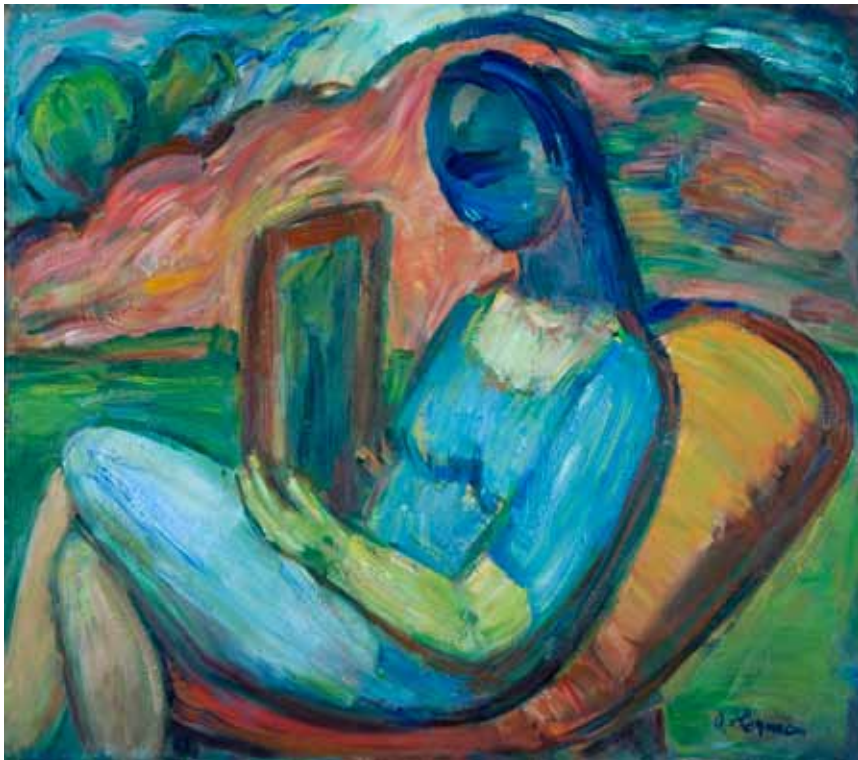
Djevojka u prirodi s ogledalom , 1972. ulje/platno 730 x 1010 mm inv. br. GKD-3 Galerija Klovičevi dvori, Zagreb