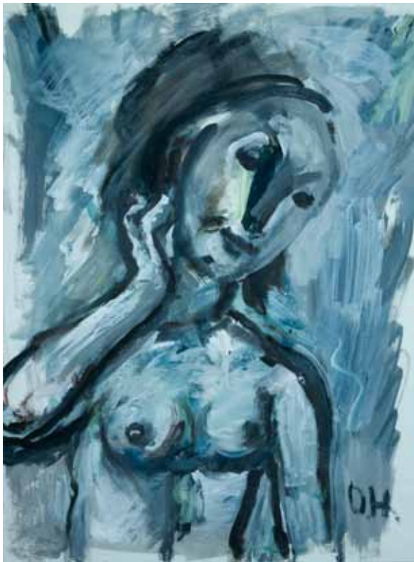
Sivi poluakt tempera/papir 553 x 444 mm inv. br. GKD-194 Galerija Klovičevi dvori, Zagreb