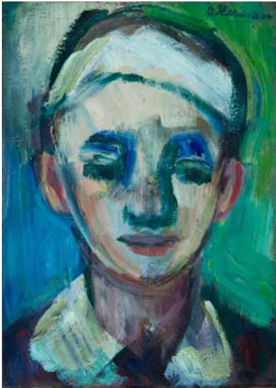
Dječak s bijelom kapom (Autoportret) , 1959. ulje/platno 334 x 235 mm inv. br. GKD-9 Galerija Klovićevi dvori, Zagreb