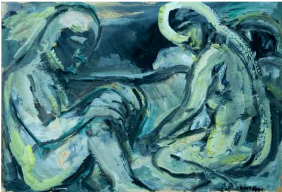
Tuga , 1974. tempera/papir 380 x 471 mm inv. br. GKD-25 Galerija Klovičevi dvori, Zagreb