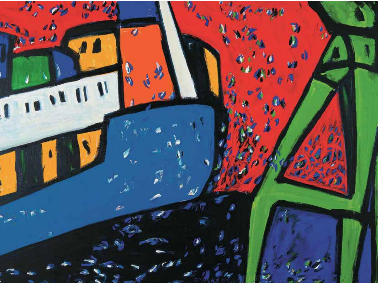
Na remontu, akril na platnu, 140 x 190 cm