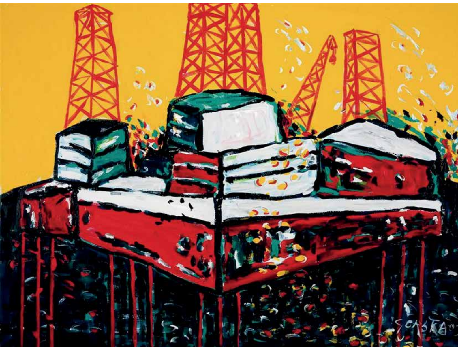
Platforma, akril na platnu, 140 x 190 cm