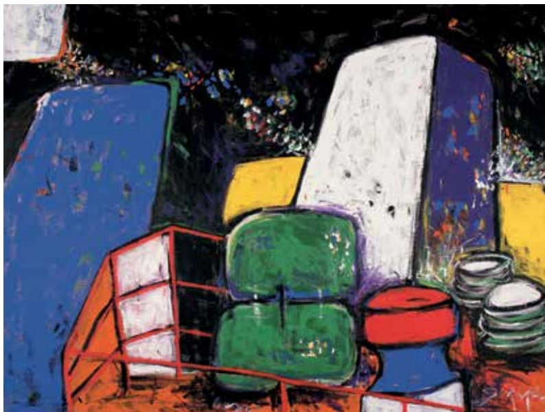
Noć na trajektu, akril na platnu, 140 x 190 cm