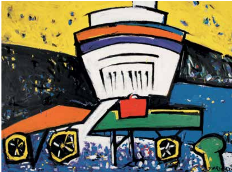
Crveni kofer, akril na platnu, 140 x 190 cm