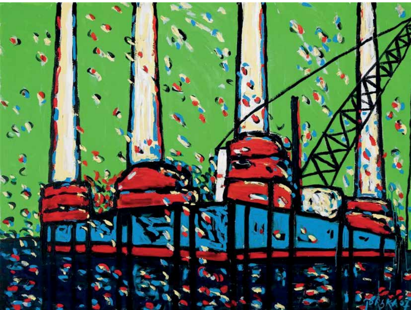
Platforma I, akril na platnu, 140 x 190 cm