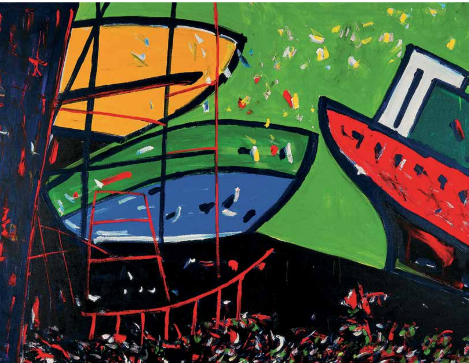
Škver, akril na platnu, 140 x 190 cm