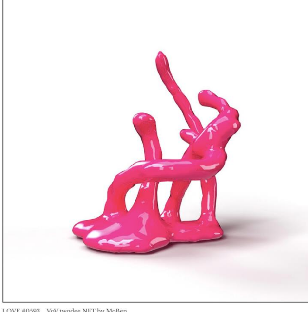
LOVE #0593 VoV twodee NFT by MoBen

Maurice Benayoun suvremeni je umjetnik, pionir novih medija, kustos i teoretičar, sa sjedištem između Pariza i Hong Konga. Njegov rad koristi razne medije, uključujući (i često kombinirajući) video, računalnu grafiku, impresivnu virtualnu stvarnost, internet, performanse, EEG, 3D ispis, urbane medijske umjetničke instalacije i velike interaktivne izložbe. Često konceptualno, djelo Mauricea Benayouna predstavlja kritičko istraživanje promjena u suvremenom društvu koje su donijele nove ili nedavno usvojene tehnologije.